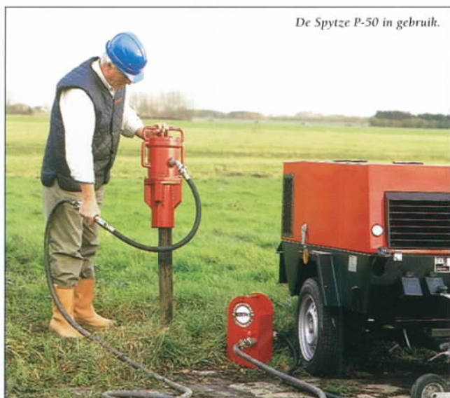
De Spytze P-50 in gebruik.

Wenst u meer informatie of bent u geïnteresseerd in een demonstratie? Neemt u dan contact met ons op.